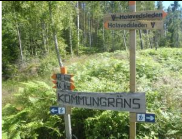
Avståndsmarkeringarna stämmer inte för tävlingen...