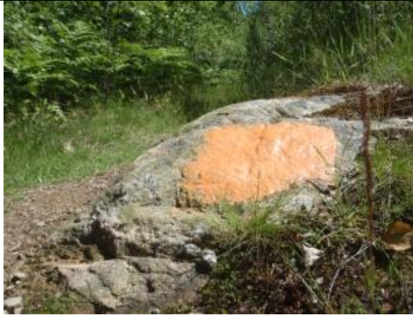
Orange markering på sten.