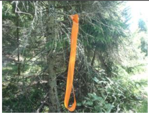
Vi har förstärkt befintliga markeringar med orangea snitslar. Kan förekomma någon enstaka röd.