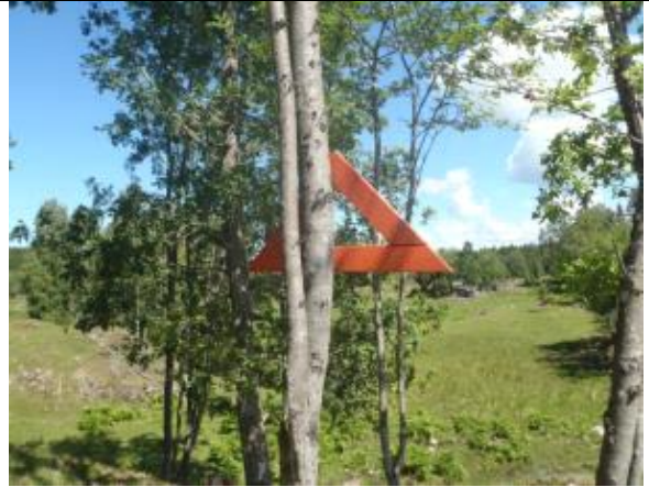
Orangea trätrianglar visar vägen genom en av hagarna.