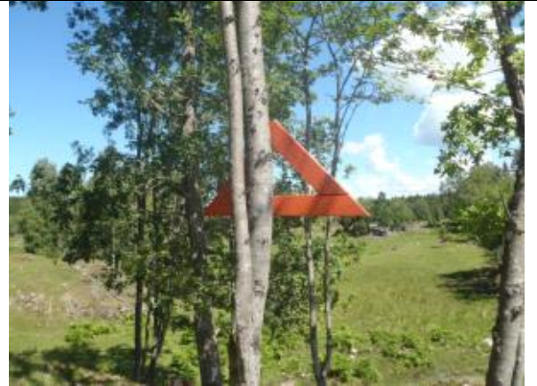
Orangea trätrianglar visar vägen genom en av hagarna.