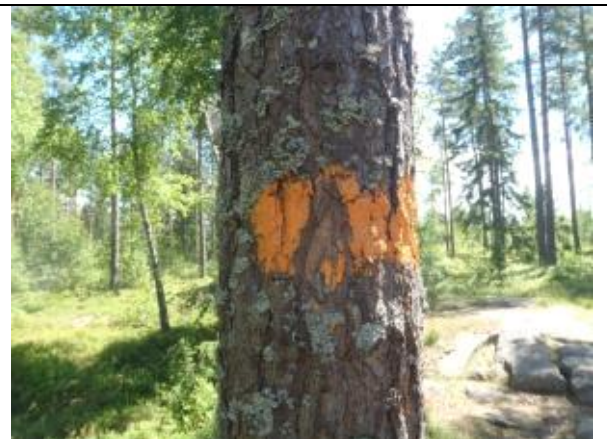
Orange färg på träd.