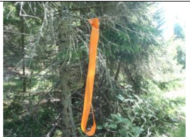
Vi har förstärkt befintliga markeringar med orangea snitslar. Kan förekomma någon enstaka röd.