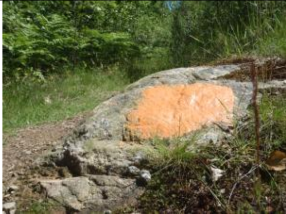
Orange markering på sten.