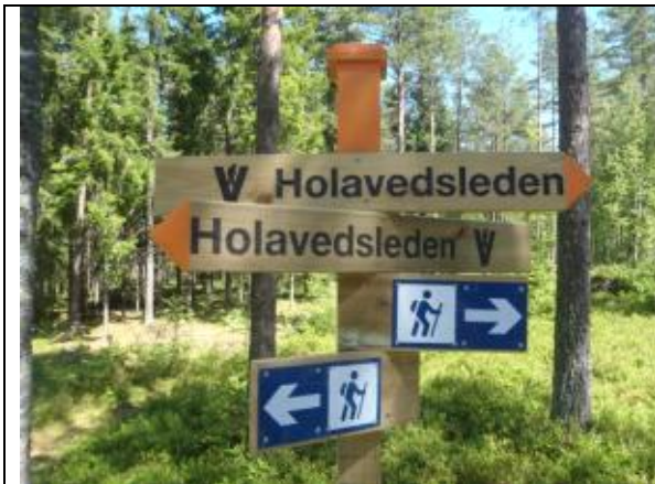
Skyltar i blått och vitt. Pilar och stolpar med orange färg.