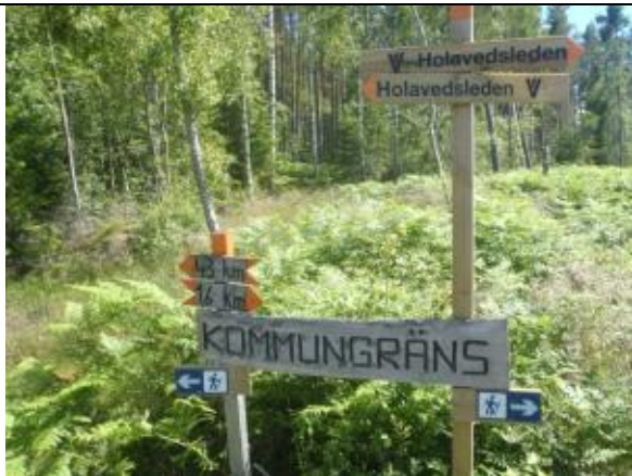
Avståndsmarkeringarna stämmer inte för tävlingen...