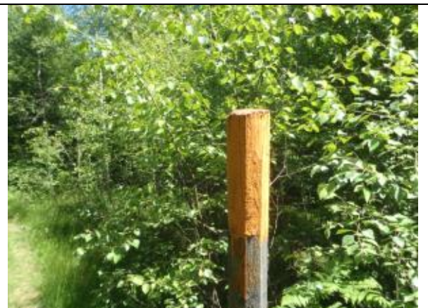
Orange markering på stolpe.