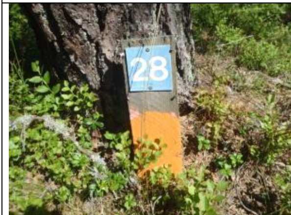
Markering i orange med siffror för sevärighet.