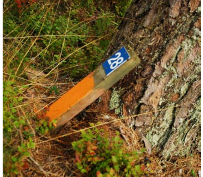
Följ de orangemålade stolparna – då kommer du rätt.

Från Gränna kan du ta söderut mot Huskvarna via John Bauerleden (50 k) och om du vill vidare, förbi Jönköping, mot Bottnaryd och Mullsjö via Södra Vätterleden.